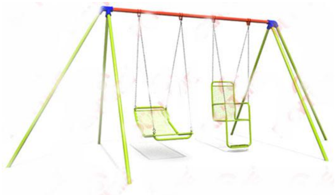
IMAGEN DE MUESTRA