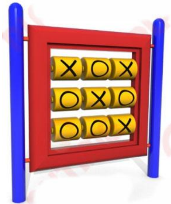
IMAGEN DE MUESTRA

Conformado por columnas de caño de acero \varnothing 3" x 2mm de espesor, terminación superior con casquillo esférico. Sujeción de panel por medio de caños de acero 1 1/2" x 1,6mm de espesor. Sujeción de fichas con caños de acero 3/4" x 1,6mm de espesor. Panel y cilindros Ta Te Tí fabricados con plástico de polietileno con protección UV, rotomoldeados. Cilindros con signos en bajo relieve y pintados, para estimular la sensibilidad táctil y visual, con terminación superficial con pintura poliéster